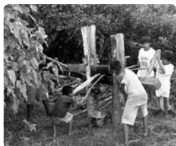
Niños Machineri moliendo caña de azúcar en un "trapiche" (molino) manual.