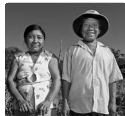
Comunarios de Cururú.

organización social y productiva, manejo forestal, gestión empresarial y comercialización. La asistencia socio-organizativa consistió en generar, a partir de la organización ancestral guaraya, instituciones e instancias de participación y control social en la actividad forestal, de tal manera que las negociaciones, el manejo, los ingresos económicos y su distribución, sean conocidos y avalados por todos. En los aspectos técnicos del manejo forestal, además de los denominados "instrumentos de gestión", como el Plan de Manejo y los Planes Operativos Anuales Forestales, incluyó aspectos de campo, como inventarios, censos, planos, corta dirigida, mediciones y otros.