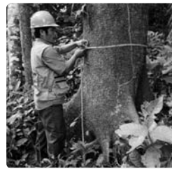
Comunario de Cururú midiendo uno de los árboles de su zona.

En el ámbito comercial, se ha instaurado el seguimiento y cumplimiento de contratos, lo que ha favorecido la