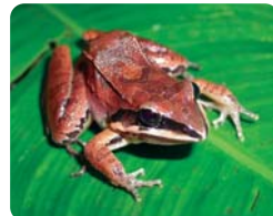
Leptodactylus mystaceus (especie de anfibio monitoreada)

monitoreo, Reichle considera que se debe ampliar la superficie bajo manejo forestal y los ciclos de corta, adecuándolos científicamente a los diferentes tipos de bosque, porque "ya sabemos que podemos intensificar el aprovechamiento forestal, pero no mucho más allá de lo que ya se hace". Igualmente, "se debe continuar rigurosamente con la medición y