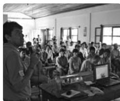
Taller de socialización de resultados BOLFOR II en Ixiamas.

Dentro del proceso de socialización de resultados que viene desarrollando el Proyecto BOLFOR II, el taller regional en Ixiamas -donde el Proyecto tiene una de sus 4 oficinas regionales-, se desarrolló el 13 de diciembre del pasado 2008 buscando compartir sus logros y resultados con autoridades locales, representantes y socios de las comunidades y ASL a las que asistió y empresarios que tienen actividades en la zona.