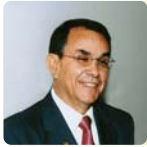
Ing. Ernesto Antelo López Presidente Instituto Boliviano de Comercio Exterior (IBCE)

El Consejo Editor de "Comercio Exterior" ha querido empezar la gestión 2009 dedicando su primera edición al sector forestal en Bolivia, el cual, en muy pocos años se convirtió en uno de los más destacados del país. Sus logros en cuanto a la conservación de los bosques, la democratización del acceso a este recurso renovable y los beneficios para las comunidades indígenas, agrupaciones sociales, productores y campesinos, son un ejemplo para el mundo y un orgullo nacional.