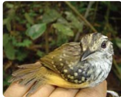
Hypocnemis cantator (especie de ave monitoreada)

Reichle indicó también que "no se encontró extinciones locales de especies, ni disminuciones significativas de poblaciones y, que incluso, hubo hasta menores índices de deforestación que en algunas áreas protegidas; por