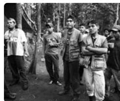
Responsables de Manejo Forestal de la AIMCU

Uno de los aspectos importantes de BOLFOR II para facilitar la sostenibilidad de sus logros, es el énfasis sistemático sobre el desarrollo de capacidades en los ámbitos local, municipal y nacional. El sector forestal boliviano y los beneficiarios de BOLFOR II enfrentan hoy nuevos y emergentes desafíos para su sostenibilidad. Los elementos específicos, sociales, financieros y ecológicos que toman resiliencia a los beneficiarios de BOLFOR II y sus logros se mencionan en términos generales a continuación: