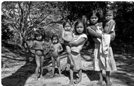
Niñas de la Comunidad de Cururú.

De acuerdo a ello, BOLFOR II desarrolló una estrategia para fortalecer instituciones públicas y privadas clave del sector forestal; promover la competitividad a través del uso sostenible de las tierras forestales;