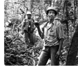
Comunario en pleno trabajo de campo.

A través de una metodología participativa, BOLFOR II acompañó el proceso de elaboración, adecuación