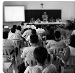
Taller de socialización de resultados BOLFOR II en Guarayos.

"Para Cururú la certificación es algo sumamente beneficioso, ya que por mucho tiempo nuestra comunidad ha venido luchando para aprender a manejar el bosque y como debe tratarse