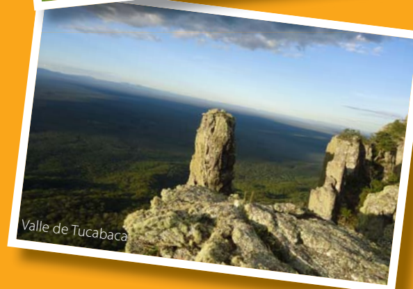
Valle de Tucabaca