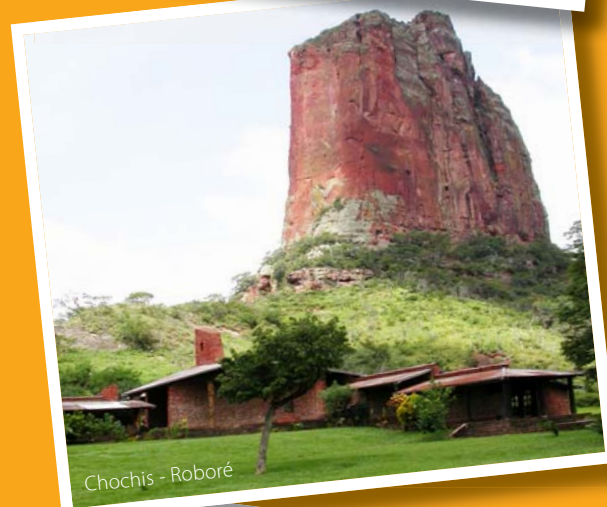
Chochis - Roboré