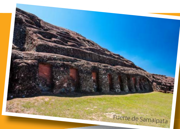
Fuerte de Samaipata

Otras de las actividades realizadas por este programa son los más de 20 talleres de capacitación turística, dictados en diferentes municipios para mejorar la atención al cliente, manipulación de alimentos, reglamentos de hospedajes y leyes vigentes de turismo.